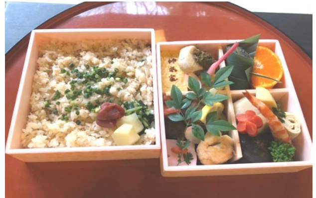
焼魚、煮物、揚物、出汁巻き玉子など華やかな大好評のお弁当です。酒の肴にも。