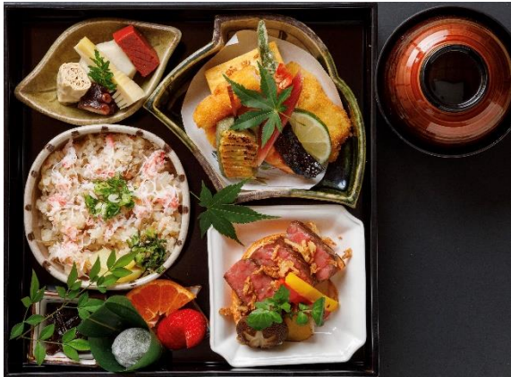
黒毛和牛ステーキ入りの懐石料理に赤だしが付きます。