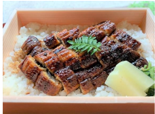
三河一色産の鰻を店内で焼き上げて秘伝のたれで味付け。上は肝入です。