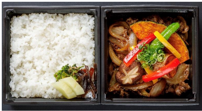
柔らかい黒毛和牛を甘辛たれとご一緒に